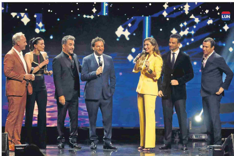
Dicen que hace años no se juntaban.

Animadores y cercanos a él apoyaron una velada que tuvo lágrimas y humor. "Esa canción me hace recordar un momento súper duro, doloroso y una partida súper injusta", explicó.