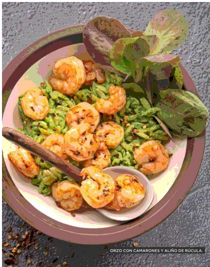
ORZO CON CAMARONES Y ALIÑO DE RÚCULA.

Tiraje: 126.654 Lectoría: 320.543 Favorabilidad: No Definida