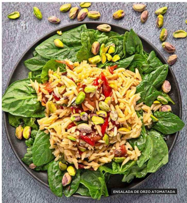
ENSALADA DE ORZO ATOMATADA

Tiraje: 126.654 Lectoría: 320.543 Favorabilidad: No Definida