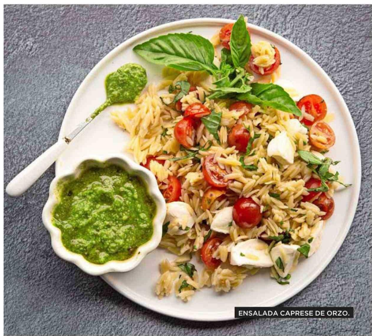
ENSALADA CAPRESE DE ORZO.