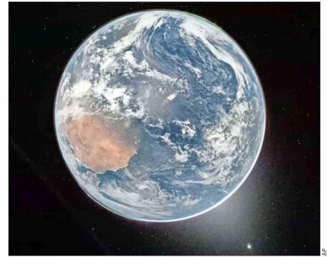
Vista de la Tierra tomada por el comandante de la misión, Reid Wiseman, desde una de las ventanas principales de la nave espacial Orion.

Artemis II tiene previsto alcanzar la órbita de la Luna antes de regresar a la Tierra, en un trayecto total de diez días.