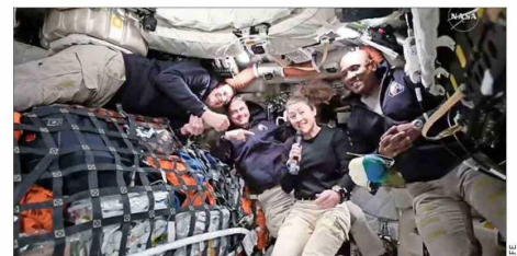
Los cuatro astronautas de la misión Artemis II dentro de la nave espacial Orion durante un contacto con la prensa el segundo día del viaje.