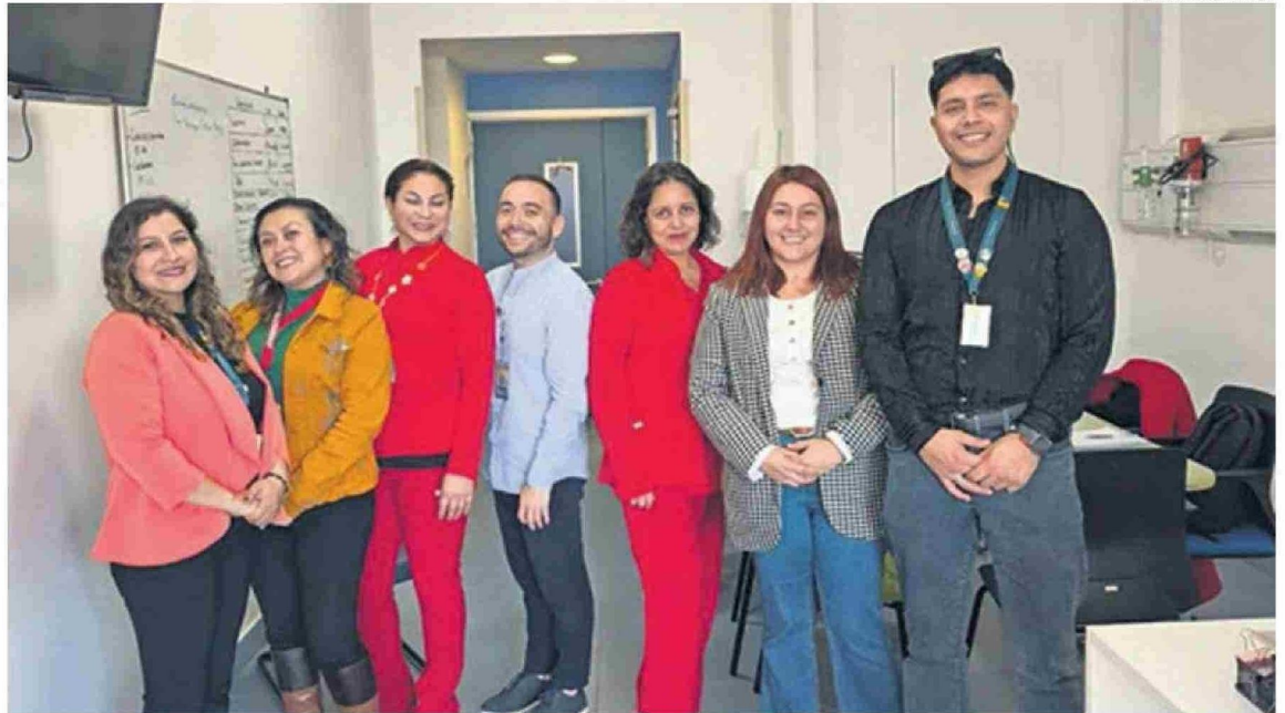
EL PLAN PILOTO EN EL HOSPITAL REGIONAL DE COPIAPÓ REFUERZA EL COMPROMISO DE LA UNIVERSIDAD DE ATACAMA CON EL DESARROLLO DE UNA CULTURA DE BIENESTAR.

Además, están desarrollando un plan piloto de fortalecimiento de la salud mental y la sana convivencia, en conjunto con el Hospital Regional de Copiapó, donde actualmente realizan su internado la mayoría de las estudiantes de Obstetricia y Puericultura.