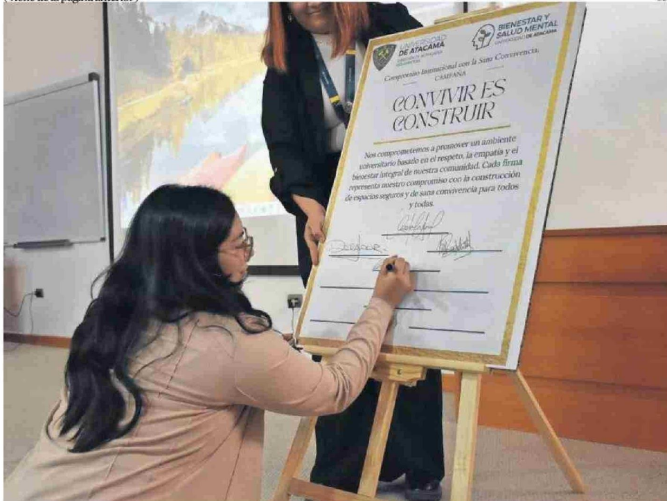
EN ABRIL DE ESTE AÑO LA UDA REAFIRMÓ SU COMPROMISO CON LA SALUD MENTAL Y OFICIALIZÓ NUEVA POLÍTICA PARA GENERAR ENTORNOS SEGUROS.