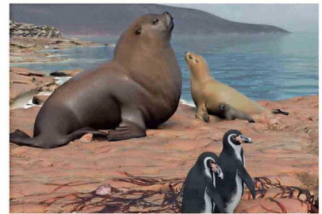
HABÍA MÁS FOCAS QUE LOBOS MARINOS Y GRANDES PINGÜINOS.

Así, el estudio confirmó que hasta hace 3 millones de años la temperatura del mar superficial del norte chileno era de unos 17.1 °C promedio, lo que es entre 3 y 4 grados más cálida que lo estimado durante el Pleistoceno, hace unos 800.000 años. Esto se asemeja más a las aguas actuales de Perú.