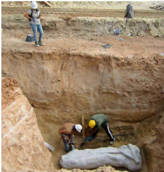
LA INVESTIGACIÓN USÓ ANTECEDENTES DE MONITOREOS A OBRAS EN COQUIMBO.

El profesional es el director científico de la Corporación de Investigación y Avance de la Paleontología e Historia Natural de Ataca-