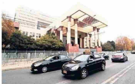
PARLAMENTARIOS Y MINISTROS ESTÁN EXCEPTUADOS DE LA NORMA.