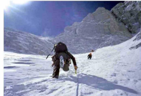
DESINTERÉS. “Subir un ochomil ya no me llama la atención. El himalayismo ha cambiado mucho”, dice.

Valores en pesos correspondiente al equivalente del precio publicado en dólares al cambio de $90 al 1 de mayo 2026, sujeto a variación según el día de la compra.