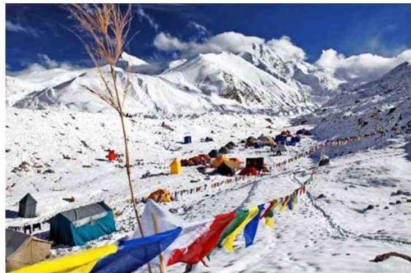
EN CHILE. Edurne Pasaban estará este martes 12 de mayo en Espacio Riesco como parte de un congreso organizado por la Fundación Lo Que De Verdad Importa. El evento es gratuito, previa inscripción. Aquí, el campo base del Shisha Pangma y coronando la cima del K2.