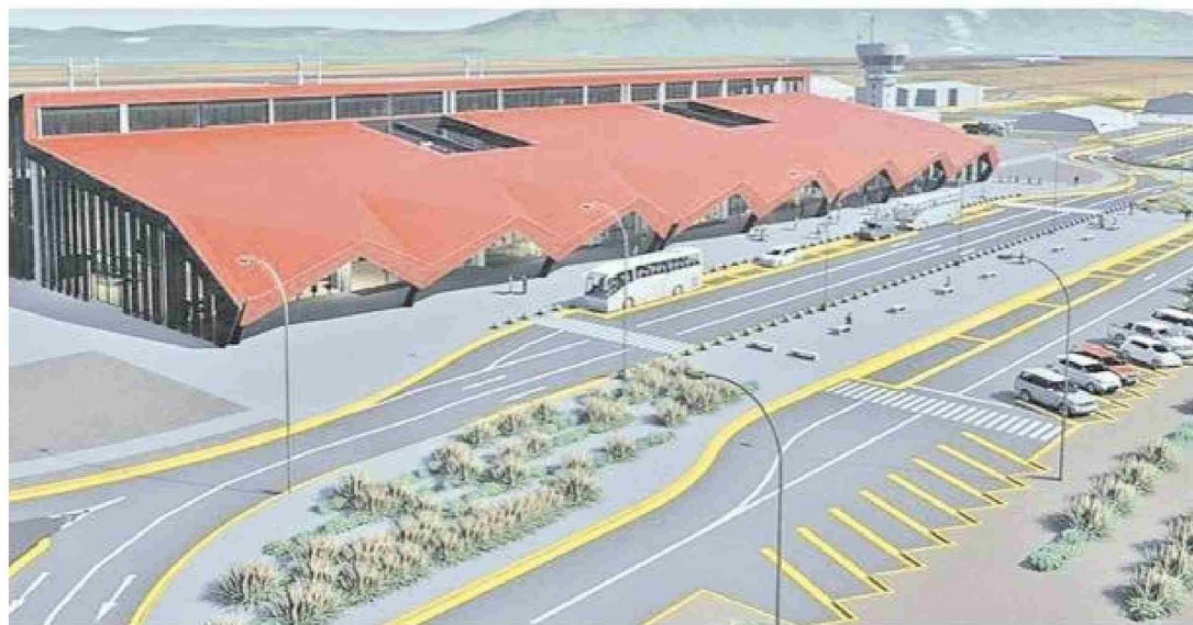
Así será el nuevo Aeródromo de Natales el cual se encuentra inspirado en un galpón de esquila. Se pasará de los 1.570 metros cuadrados existentes a los 10.570 metros cuadrados. Esta edificación costará $23 mil millones.

Las faenas comenzarían en abril de 2028 y se extenderían por dos años. Actualmente, la Seremi de Obras Públicas se encuentra realizando el proceso de consultoría, la cual finaliza en septiembre de este año. En dicho mes empezaría la fase del diseño y luego la expropiación de terrenos, la que se extendería al menos