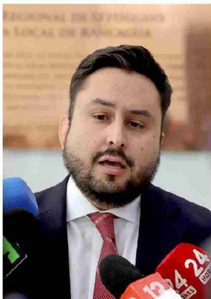
El fiscal, Nicolás Núñez, manifestó su conformidad por la condena que recibió el exalcalde.