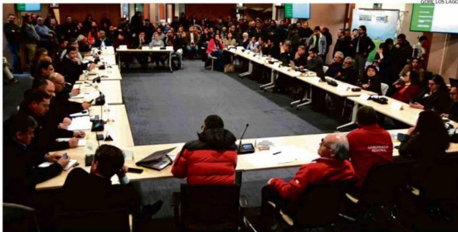
EL CRUBC RECHAZÓ UNA SOLICITUD INDÍGENA SOBRE TERRITORIO DE PUERTO MONTT EN OCTUBRE DEL AÑO PASADO.

"Quiénes hemos podido trabajar o dialogar con comunidades indígenas, en diversas otras materias, también con comunidades lafkenches, la experiencia nos enseña el conocimiento de la legislación de que todo proceso debe realizarse a través de las consultas indígenas. No estaré para aprobar ninguna modificación si es que no pasa por consulta indígena reglamentada por el artículo 169 de la OIT", afirmó. C-3