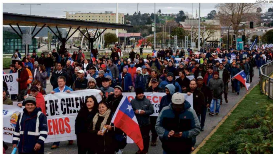
UNA MASIVA MANIFESTACIÓN EN CONTRA DE LA LEY LAFKENCHE SE REALIZÓ EN JUNIO DE 2024 EN PUERTO MONTT.

miércoles, el subsecretario de Pesca y Acuicultura, Osvaldo Ulloa, especificó ante la Comisión de Pesca, Acuicultura e Intereses Marítimos de la Cámara de Diputados que el Gobierno impulsará modificaciones concretas a la normativa, detallando cuáles son, a juicio del Ejecutivo, las principales falencias detectadas.