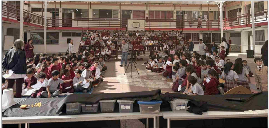
Estudiantes del Colegio Alonso de Ercilla participaron activamente en la jornada, conociendo de cerca diversas especies exóticas.

Durante la jornada, los estudiantes tuvieron la oportunidad de observar de cerca a estas especies y conocer deta-