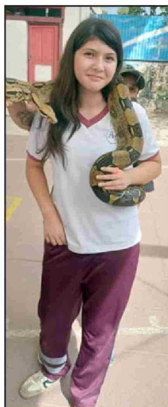
Tucanes, guacamayos, boas y lagartos fueron parte de la experiencia educativa.