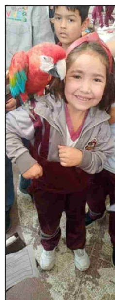
Niños y niñas vivieron una experiencia única.