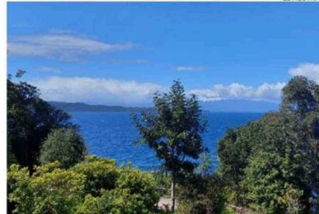
EL TERRENO DEL HOTEL CUENTA CON UNA VISTA PRIVILEGIADA DEL LAGO.

el Hotel Centinela fue entregado al municipio por los concesionarios y desde entonces sólo se realiza una mantención mínima del lugar. Incluso fue blanco de los ladrones.