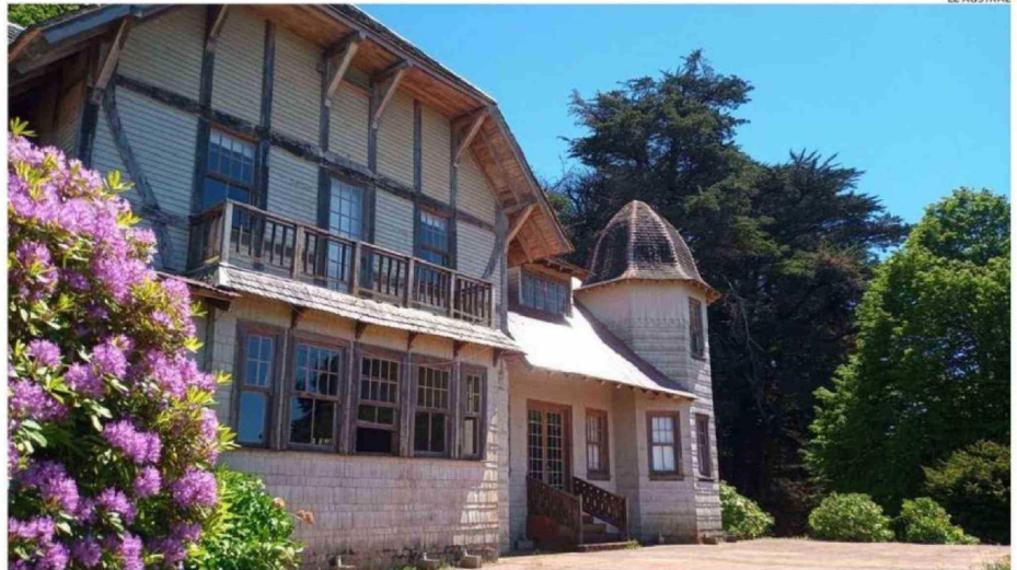
EL HOTEL CENTINELA TUVO SU ÉPOCA DORADA A PRINCIPIOS DEL SIGLO XX, DONDE INCLUSO SE HOSPEDARON LOS PRÍNCIPES DE GALES.

PUERTO OCTAY. El municipio está en la etapa final de la elaboración de bases para entregar en concesión el terreno y la casona edificada en 1913. Hasta mayo del 2015 estuvo en manos de un privado y desde entonces ha sufrido una serie de problemas legales y falta de cuidado, que afectaron el inmueble considerado un patrimonio para la comuna lacustre y la provincia.