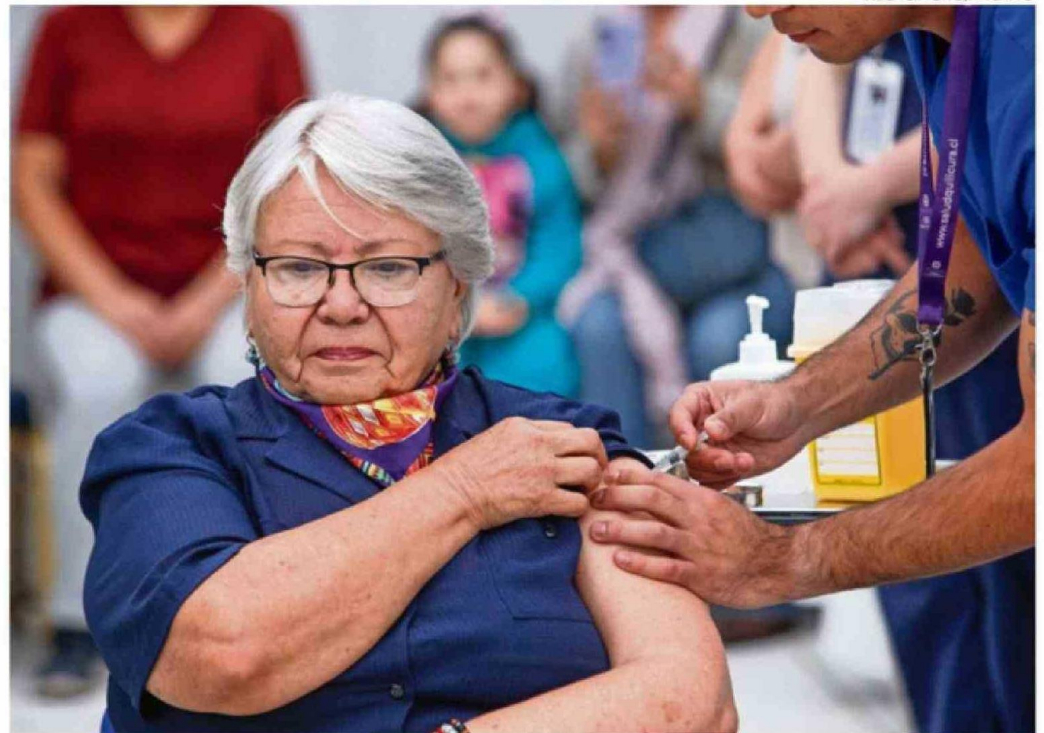
MEDIDA INCLUYE ADULTOS MAYORES, ENFERMOS CRÓNICOS Y CUIDADORES DE ADULTOS MAYORES EN ELEAM.

nicos pueden recibir la vacuna desde los 6 meses hasta los 59 años (anteriormente, estaba fijado para mayores de 18).