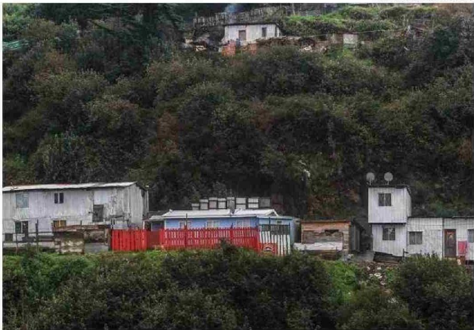
EN LA LADERA MACIVER FUERON CATASTRADAS 23 FAMILIAS, CON UNA POBLACIÓN ESTIMADA DE 60 PERSONAS.