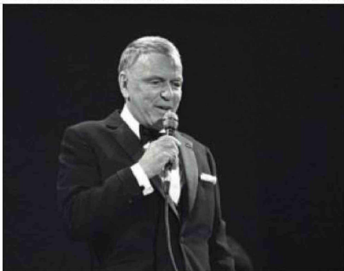
El último show de Frank Sinatra fue el 25 de febrero de 1995. En la foto, en una presentación de 1986 en Madrid.