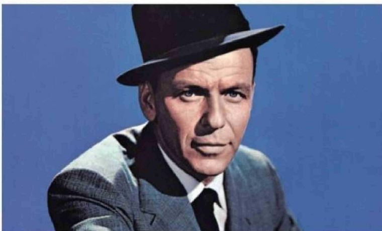
Frank Sinatra nació en Hoboken, Nueva Jersey, el 12 de diciembre de 1915. Hijo único de una pareja de inmigrantes italianos afincados en Estados Unidos.