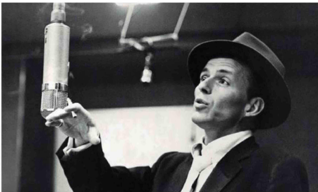
Frank Sinatra padeció, entre otras cosas, en los últimos años de vida, problemas cardíacos y un principio de demencia que le generaba dificultades para recordar sus canciones.

hasta las 2:00 de la mañana para verlo y escucharlo cantar.