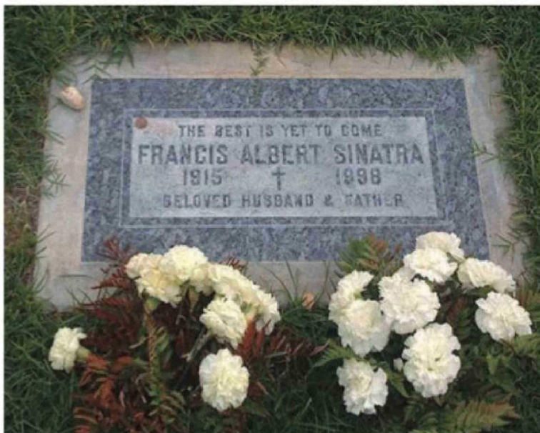
"Lo mejor está por venir", la leyenda en la lápida de Frank Sinatra que en 2020 fue vandalizada por manos anónimas.