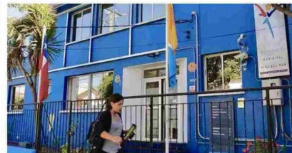
Sindicato anuncia huelga por contrato de $3.000 millones, pero Corporación Municipal de Viña asegura que negociación colectiva es ilegal