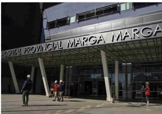
Hospital Provincial Marga Marga entra en tierra derecha: este jueves será entregado administrativamente al Servicio de Salud