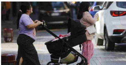
Hacienda recorta $32.721 millones a Desarrollo Social y afecta programas clave de Niñez e Indígenas