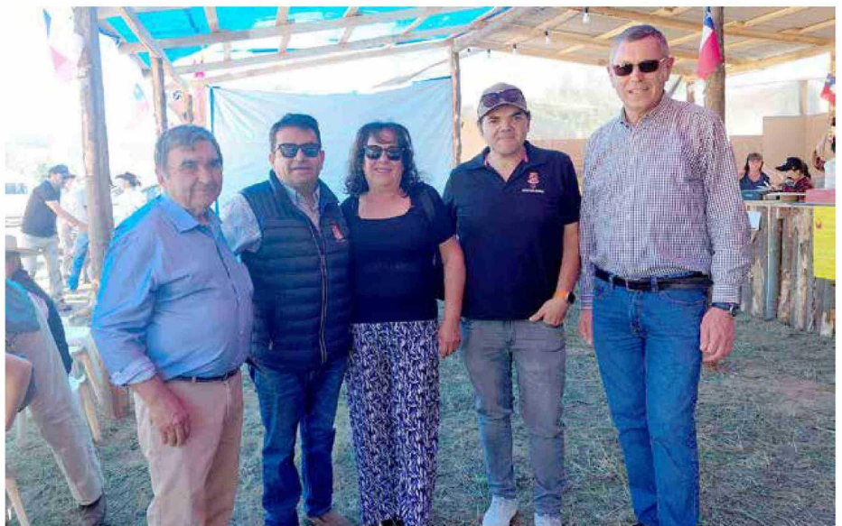
Para quienes viven en sectores alejados, estas obras tienen un valor aún mayor, porque les permiten sentir que avanzan y que sus necesidades están siendo consideradas.