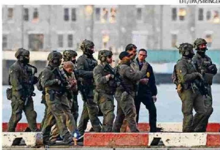
MADURO Y FLORES LLEGARON ESPOSADOS Y VIGILADOS.