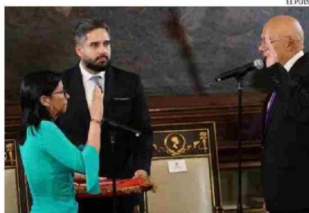
DELCEY RODRÍGUEZ JURÓ COMO PRESIDENTA ENCARGADA.