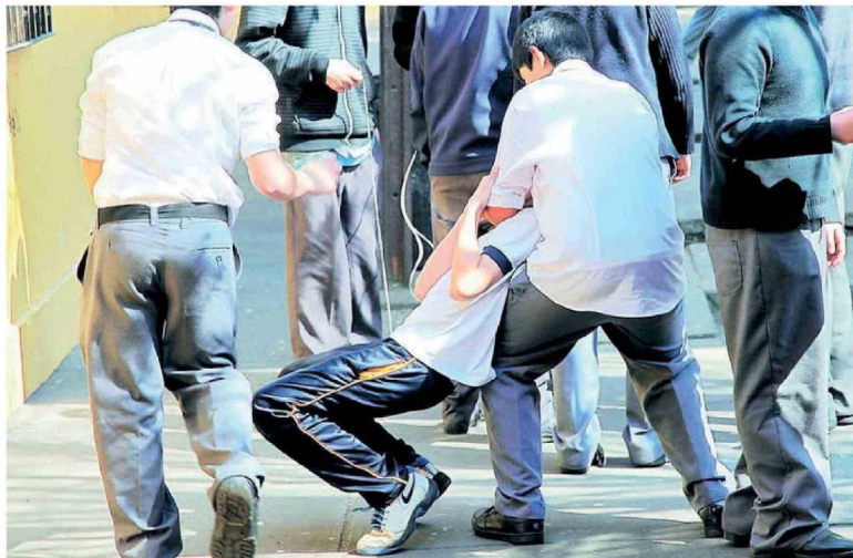
LA REGIÓN DEL BIOBÍO se ubica en segundo lugar nacional con más casos de expulsiones escolares. Pasó de tres expulsiones en 2016 a 158 en 2024.

mientos con alta vulnerabilidad socioeconómica. En 2024, casi dos tercios de las expulsiones se registraron en colegios donde más del 60% del alumnado es prioritario.