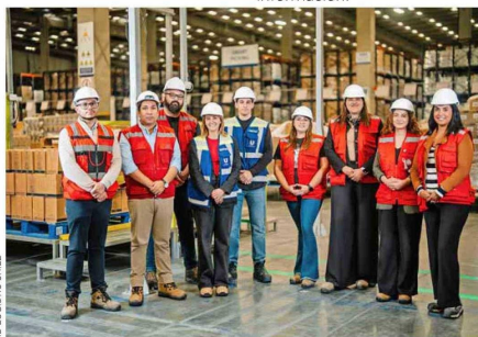
El proceso colaborativo de ID Logistic y Unilever combinó visión estratégica, innovación tecnológica y un fuerte foco en las personas.

estandarizados y una gestión avanzada de la información, permitió construir una operación capaz de adaptarse rápidamente a nuevas demandas.