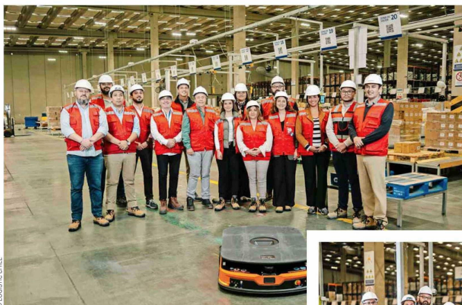
Ambos equipos trabajaron en conjunto para redefinir la forma de operar, poniendo la seguridad, la calidad de vida y la escalabilidad en el centro de la estrategia.

Uno de los principales desafíos identificados fue reducir los riesgos asociados a la interacción entre personas y equipos, sin afectar la productividad. La respuesta fue un rediseño integral de la operación, apoyado en