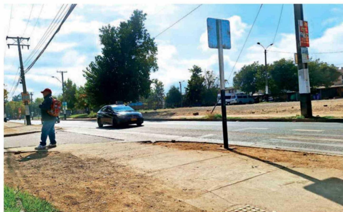
Juan Rivera Jara se sube a su micro favorita, la "C". No le hablen de colectivos.

frido un alza de entre 15 y 20 mil pesos diarios. En total, está perdiendo unos 200 mil pesos. No es poco.