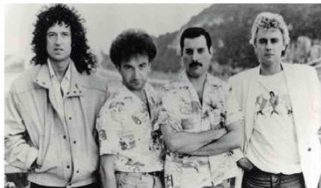
El legado musical de Freddie Mercury y Queen está más vigente que nunca tras el acuerdo millonario con Sony Music.