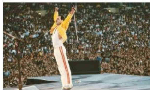
El diagnóstico de VIH en 1987 marcó sus últimos años, pero no detuvo su creatividad.