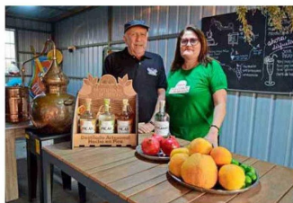
En Destilados del Desierto usan frutas locales.