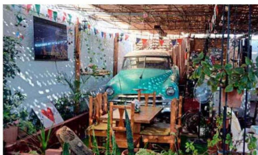
La Cachimba del Nono abrió en septiembre.