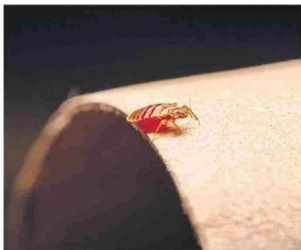
LA INVESTIGACIÓN FUE REALIZADA EN VIRGINIA TECH.

cimiento temprano de grandes asentamientos humanos que se expandieron en ciudades como