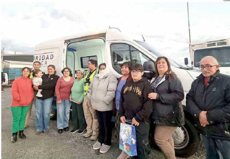
EL CUARTEL MÓVIL DE LA MUNICIPALIDAD DE CALBUCO BUSCA UN MAYOR ACERCAMIENTO CON LA COMUNIDAD EN EL SECTOR LA VEGA.

era el recorte del presupuesto que se buscaba implementar en la cartera de Seguridad, echando pie atrás el gobierno.