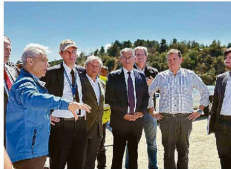
ARRAU CONOCIÓ EL SISTEMA REVERSIBLE LOS AROMOS-CONCÓN.