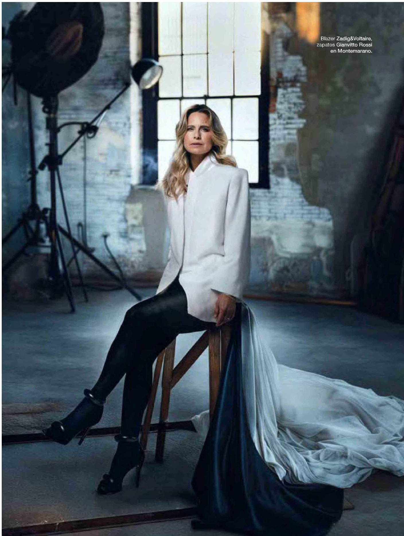
Blazer Zadig&Voltaire, zapatos Gianvito Rossi en Montemarano.

Tiraje: 6.000 Lectoría: 18.000 Favorabilidad: No Definida