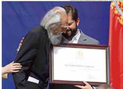
En 2023 recibió el Premio Nacional de Humanidades.

PENSAMIENTO Y LEGADO Hasta sus últimos días fue profesor emérito de la Uni-