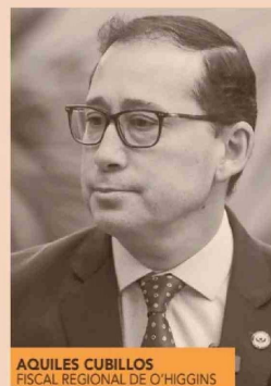
AQUILES CUBILLOS FISCAL REGIONAL DE O'HIGGINS

Se trata de un hito no solo para su carrera, sino que también para la misma Fiscalía de la Región de O’Higgins. “Bajo ninguna administración de ningún fiscal regional habíamos tenido causas mineras de esta naturaleza, salvo algunas de conflictos entre trabajadores, pero no de este nivel de tecnicismos mineros puros y duros”, cuenta a DF un conocedor de la interna. Por eso, en el último año, Cubillos se ha sumergido en la operativa de Codelco y las divisiones productivas. De hecho, convocó al Consorcio de Universidades del Estado de Chile para que académicos especialistas colaboren en la investigación de El Teniente, en materias como minería subterránea, sismicidad y estallidos de roca. Así, aunque su trayectoria ha estado marcada por su rol como fiscal en distintas comunas