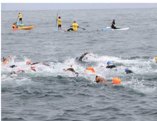
Más de 200 competidores desafiaron las aguas nadando diversas distancias.