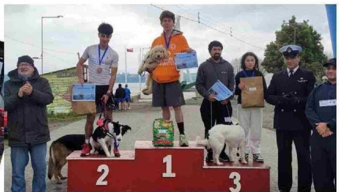
EL PODIO DE LOS PERRITOS MEDIANOS EN LA JORNADA EN PUNTA DE LAPAS.