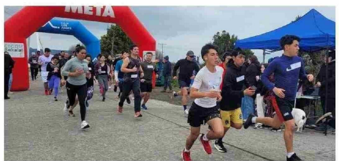
EL ENCUENTRO INCLUYÓ UNA CORRIDA SIN MASCOTAS. FUE TODO COMPETIDOR Y ENTREGÓ PREMIOS POR GÉNERO.

“A pesar de la postergación, todo se desarrolló muy bien y con buena convocatoria. Agradecemos a todos los participantes, familias y colaboradores”.