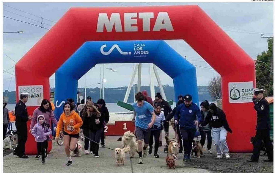
CADA VEZ SE TORNAN MÁS COMUNES LAS CORRIDAS DE AMOS HUMANOS JUNTO A SUS PERROS.

"Esta fue una jornada enmarcada en la conmemoración del Mes del Mar. A pe-