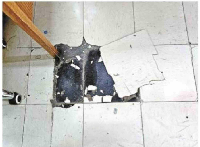
Algunos de los daños en la sala del 7ºB: un vidrio quebrado con un agujero de pedrada, sin reponer; y una muestra de las losas desprendidas en el suelo, que además se percibe roto al caminar.