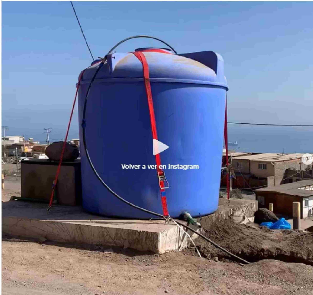
► Pese a que obtiene el registro de personalidad jurídica a inicios de 2022, la fundación constata iniciativas desde mediados de 2021.

cuentro entre la sociedad civil y la institucionalidad que permitan aumentar el compromiso de la ciudadanía con la democracia”.