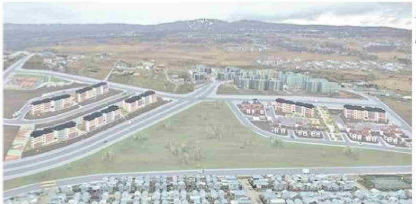
Así lucirá en el futuro el nuevo barrio que se construye en la prolongación Pedro Aguirre Cerda, ejecutado por la empresa Salfa.

Además, se contempla la futura conexión del sector con la Avenida Circunvalación, lo que permitirá una mejor integración al resto de la ciudad, especialmen-