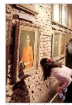
El Museo de Bomberos, en Santiago, fue uno de los atractivos.