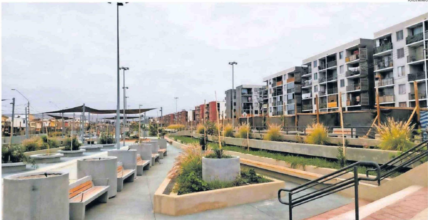
EL ESPACIO PÚBLICO DE 1,7 HECTÁREAS CUENTA CON UNA MODERNA INFRAESTRUCTURA URBANA DESTINADA PARA LA RECREACIÓN, ESPARCIMIENTO Y ENCUENTRO DE LA COMUNIDAD.