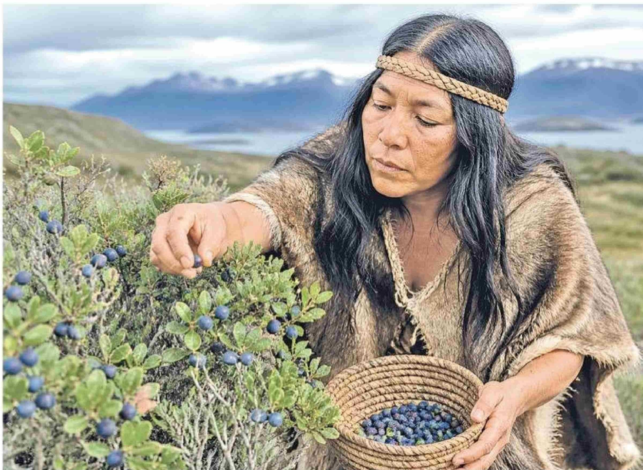
IMAGEN: GENEZIOVA CON LA