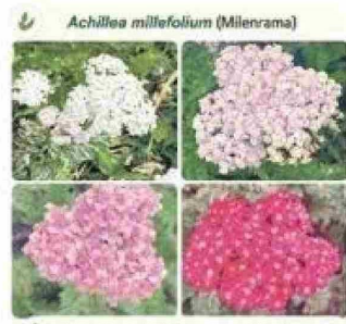
Variedades de Milenrama en Magallanes

Scientific Reports 1(2): 424-431 (2012) Carlo Sarno et al. RESEARCH ARTICLE THERAPEUTIC EFFECT OF OINTMENT FOR PSORIASIS BASED ON ACHILLEA MILLEFOLIUM L., CALENDULA OFFICINALIS L. AND SALVIA OFFICINALIS L. Anna Hamaci 1 *, Elizabeth Ginko 2 , Nina Galić 3 , Ermina Glavic Kuzarević 4 , Bekirbašević 5 , Dženana Hamacić 6 , Džena Šarić-Kurudžić 7 *Correspondence: hamaci@ptt.hr