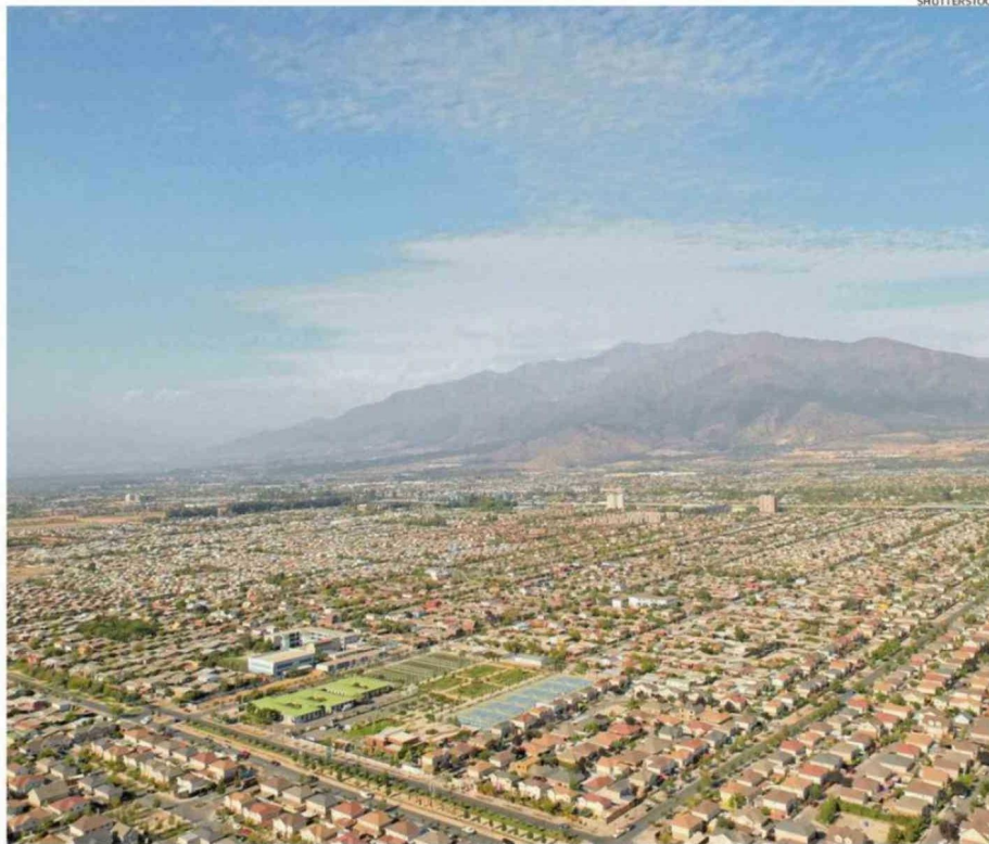
La comuna de Puente Alto es una de las comunas que está sobre el “clúster sísmico”.

“Usamos una técnica avanzada llamada ‘template matching’, que es como to-