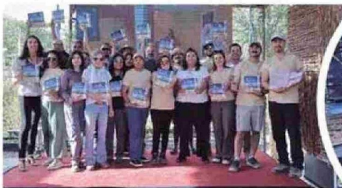
Proguías fueron actores y actrices importantes en la concepción de este manual.