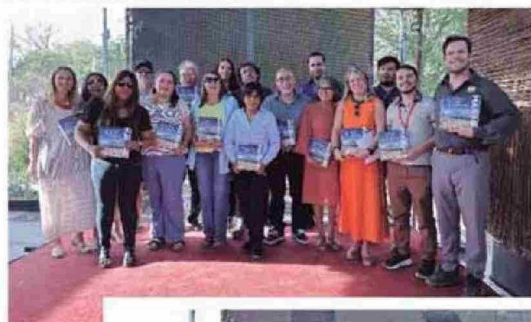
Representantes de la Mesa Litur que participaron activamente en la creación de este manual.