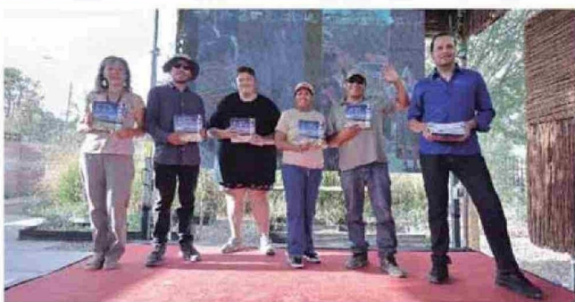
Representantes de Astroloa reciben Manual de Guías.

E ste mes de enero se realizó el lanzamiento y entrega del Manual Turístico, Una guía para guías, una herramienta construida desde el territorio para fortalecer el trabajo de guiado y la interpretación del oasis de San Pedro de Atacama . El documento es resultado de más de tres años de trabajo colaborativo entre comunidades,