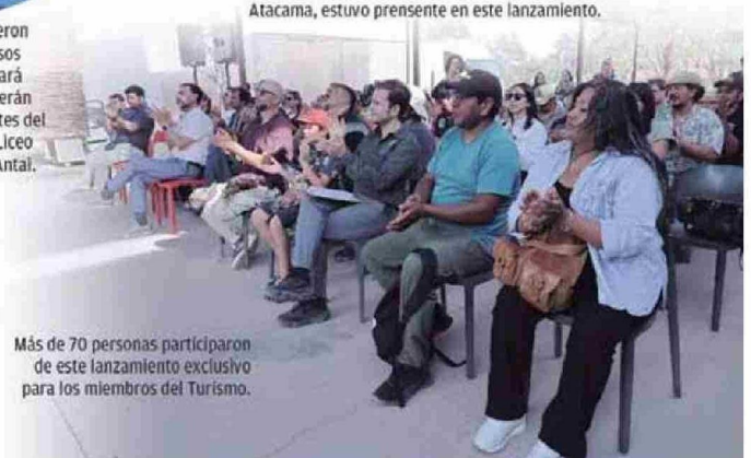
Más de 70 personas participaron de este lanzamiento exclusivo para los miembros del Turismo.