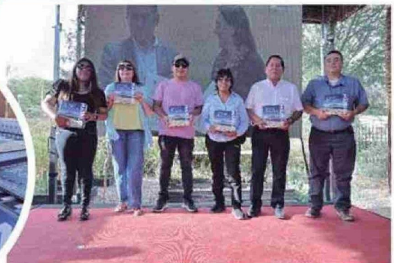
La Cámara de Comercio y Turismo de San Pedro de Atacama, estuvo presente en este lanzamiento.

Estos ejemplares fueron entregados a diversos actores locales, estará disponible online y serán entregados a estudiantes del área de turismo del Liceo Bicentenario Lickan Antai.