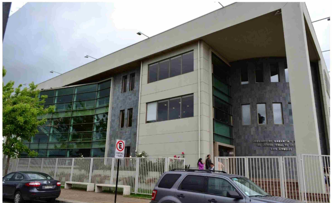
LA AUDIENCIA DE PREPARACIÓN de juicio oral por este atentado incendiario se llevará a cabo en el Juzgado de Garantía de Los Ángeles.

Según información recabada por La Tribuna, la audiencia tuvo que ser aplazada porque el Ministerio Público no habría entregado los antecedentes del caso a la defensa. En su oportunidad, se solicitó a la Fiscalía dejar disponible la carpeta con los documentos para que la defensa pudiera retirarlos y preparar su participación.