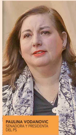
PAULINA VODANOVIC SENADORA Y PRESIDENTA DEL PS

La senadora opositora independiente Alejandra Sepúlveda da cuenta de la preocupación que le genera la