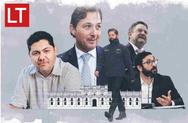
Reportajes | Págs. 12-14