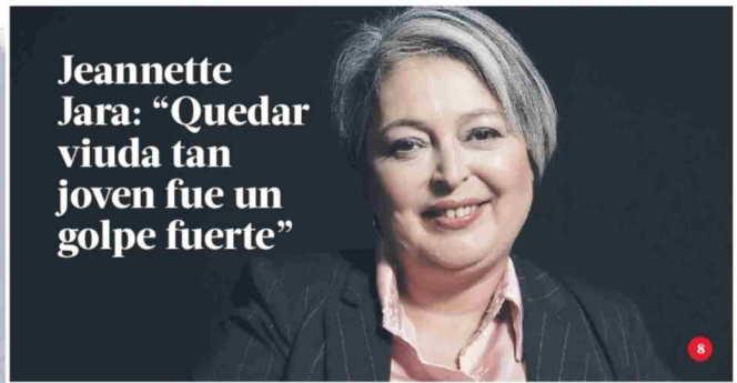
Pulso | Págs. 2-3