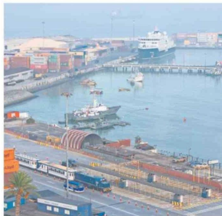
ÚLTIMO CRUCERO RECALÓ CON 150 TURISTAS.

Esta es la segunda oportunidad que se realiza el