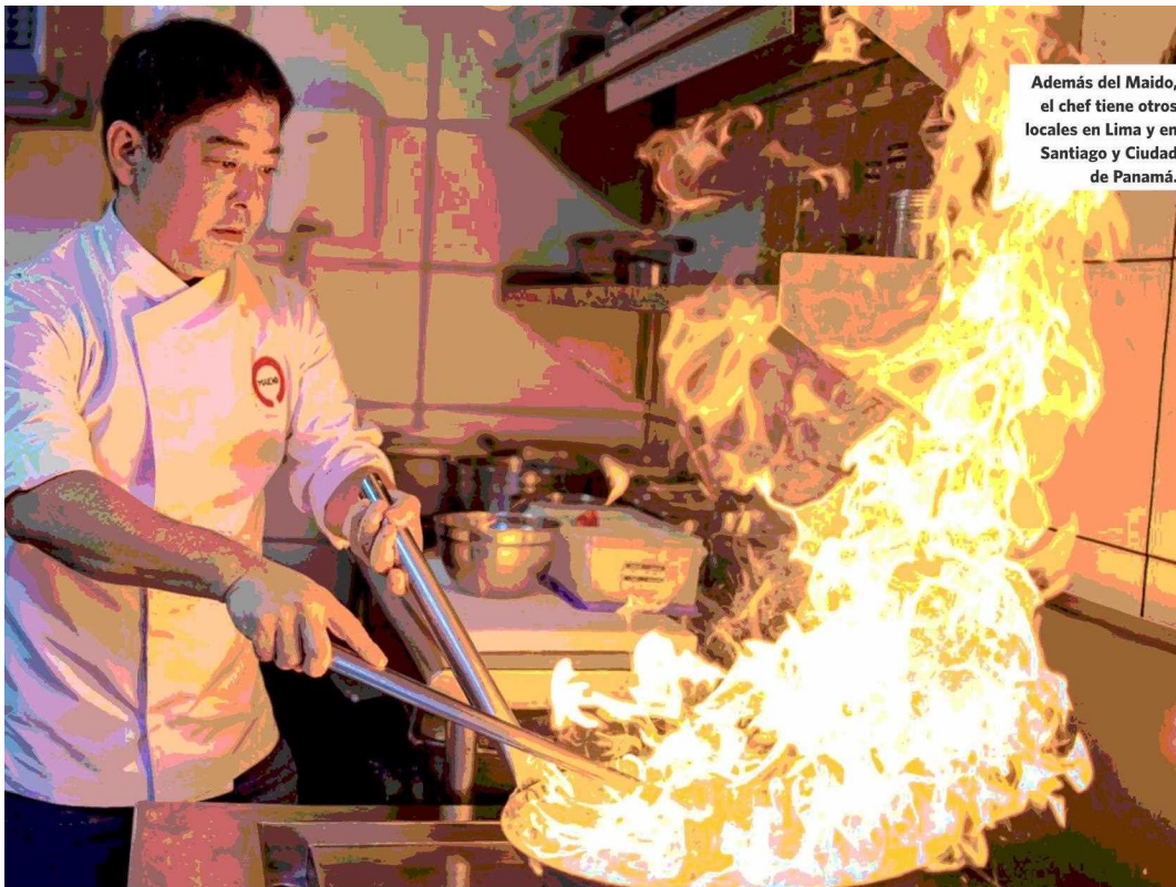
Además del Maido, el chef tiene otros locales en Lima y en Santiago y Ciudad de Panamá.