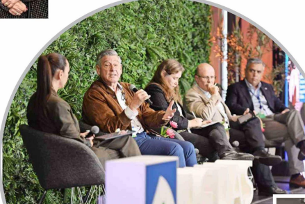
Aguas Andinas reunió a diversos expertos para reflexionar sobre proyecciones climáticas y desafíos hídricos de la Región Metropolitana.