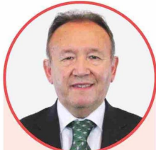
José García Ruminot

SEGPRES: Militante RN. Contador público y auditor. Actualmente, es senador por la 15.ª Circunscripción Sur, Región de La Araucanía. Ejerció como presidente del Senado, entre el 19 de marzo de 2024 y el 26 de marzo de 2025.