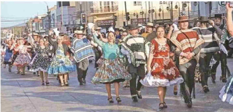
Quince clubes de cueca saludaron con un esquinazo folclórico a la Armada.

Tiraje: 5.200 Lectoría: 15.600 Favorabilidad: No Definida