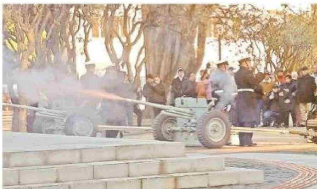
A las 12,10 horas, se disparó la tradicional salva de los 21 cañonazos en la Plaza.

En su discurso, el contraalmirante recordó la hazaña de Arturo Prat y sus hombres, que con valentía defendieron el honor de la Patria en las aguas de Iquique y Punta Gruesa, y sobre el actual quehacer institucional, subrayó que "en los últimos años hemos avanzado decididamente en la modernización de nuestras capacidades", valorando la Política Nacional Continua de Construcción Naval, cuya hito garantiza como política de Estado a largo plazo, que los buques que la Armada necesitará en el futuro, po-