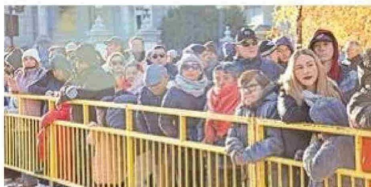
La sensación térmica bajo cero no fue obstáculo para que numeroso público se apostara en la Plaza de Armas.

A continuación, vino la salva de 21 cañonazos acompañada por el repique de campana, para seguir con el momento solemne en que autoridades civiles e instituciones armadas, proceden a depositar las ofrendas florales a un cos-