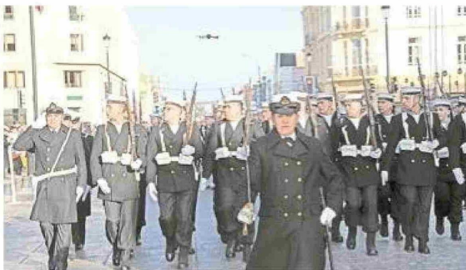
La presentación de la primera compañía de la Tercera Zona Naval.