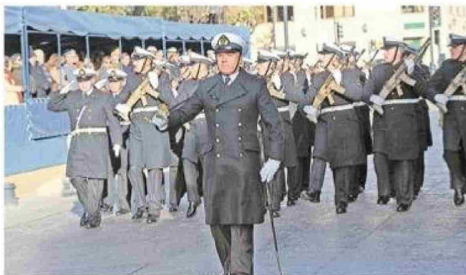
Sección del Destacamento de Infantería de Marina.

En su alocución en homenaje a la Glorias Navales