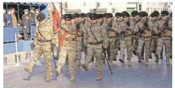
Rinde honores a los héroes de Iquique, una compañía de formación de la Cuarta Brigada Acorazada Chorrillos del Ejército.