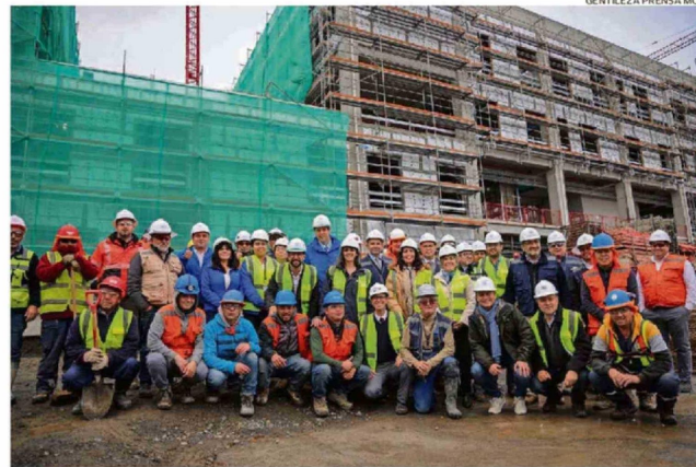
EL MINISTRO ARRAU SE REUNIÓ CON AUTORIDADES Y SALUDÓ A TRABAJADORES EN LAS OBRAS.

Además constataron el progreso del futuro recinto hospitalario de Río Bueno, con traba-