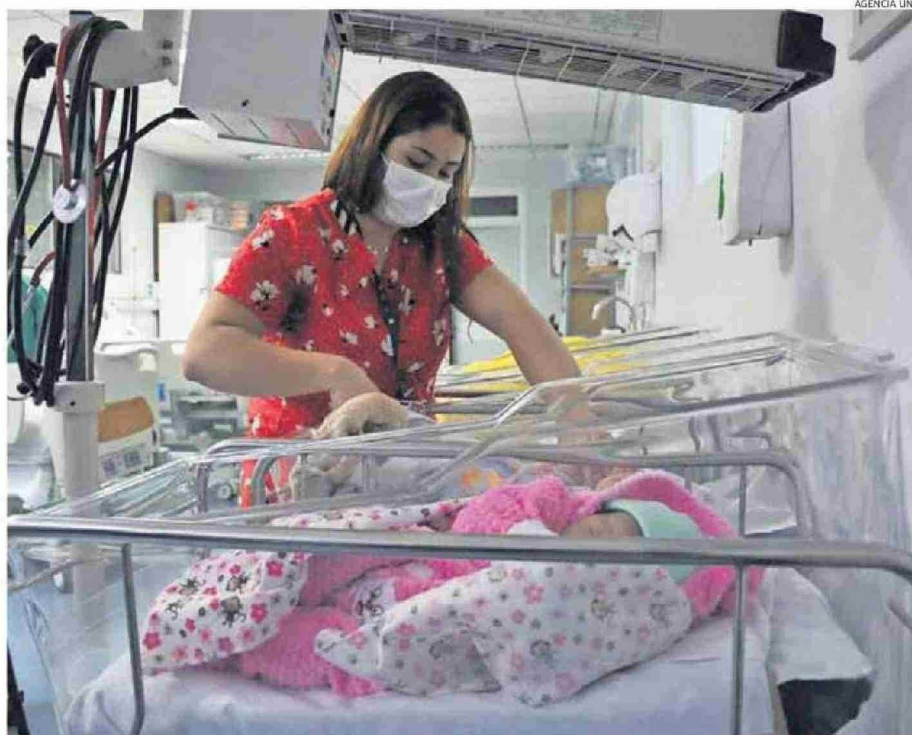
6.217 NACIMIENTOS SE REGISTRARON EL 2025 EN LA REGIÓN DE ANTOFAGASTA.