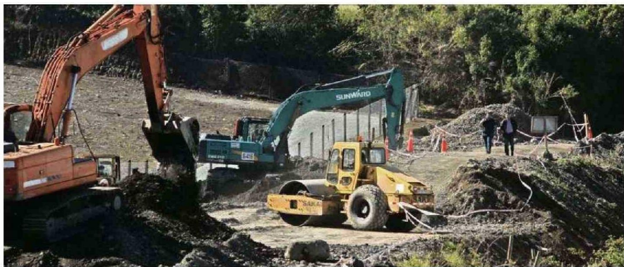
EN PUERTO VARAS SIGUEN CON LAS LABORES EN EL TALUD UBICADO EN LA POBLACIÓN MICHELLE BACHELET 2.

Vicente Pereira vicente.pereira@diariollanquihue.cl