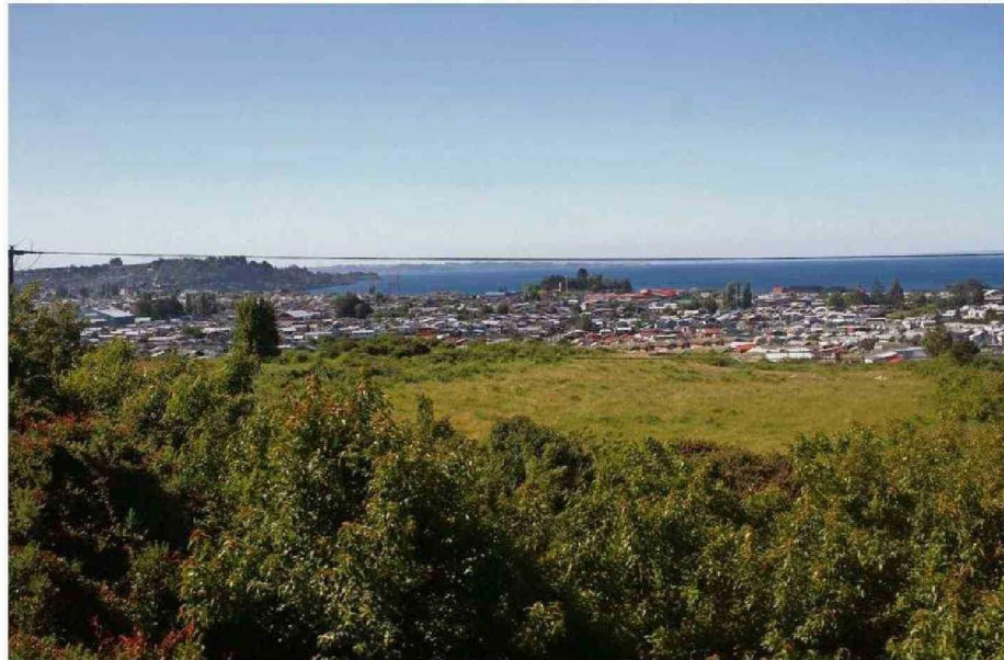
UNA VISTA DE PUERTO VARAS QUE OBSERVARÁN QUIENES SE TRASLADAN EN TREN.