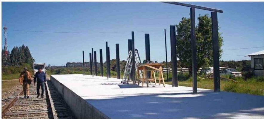
DISTINTOS TRABAJOS SE REALIZAN EN EL PARADERO UBICADO EN ALERCE. TAMBIÉN CONTARÁ CON BUSES DE ACERCAMIENTO.

INSPECCIÓN. El proyecto considera buses de acercamiento en dos puntos: La Paloma y Alerce. Además, las obras en el talud de Puerto Varas tienen un avance de un 75%. Presidente de EFE ratificó que marcha blanca del tren partirá este mes.