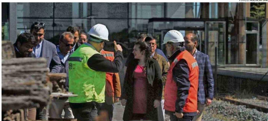
EL RECORRIDO PARTIÓ LA TARDE DE AYER DESDE LA ESTACIÓN LA PALOMA, LUGAR QUE CONSIDERA BUSES DE ACERCAMIENTO.

INSPECCIÓN. El proyecto considera buses de acercamiento en dos puntos: La Paloma y Alerce. Además, las obras en el talud de Puerto Varas tienen un avance de un 75%. Presidente de EFE ratificó que marcha blanca del tren partirá este mes.